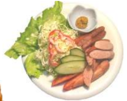
ウィンナー盛り合わせ